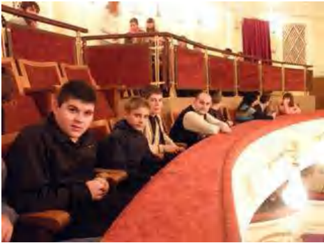
Група 11-Х чекає на виставу

Приємний вечір спілкування з театром відбувся у студентів і викладачів Полтавського