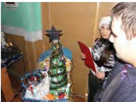
«Лісова казка» групи 11-Т

Журі не змогло приховати свого захвату від справжніх витворів, шедеврів прикладного мистецтва.