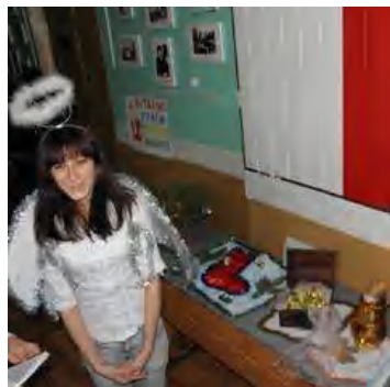
«Янгольська» композиція групи 21-ТХ

19 грудня 2011 року, напередодні новорічних свят, у День святого Миколая, студенти Полтавського технікуму харчових технологій НУХТ стали учасниками конкурсу на тему «Подарунки від святого Миколая». Вони виявляли свою фантазію і талант, виготовляючи новорічні ікебани з природного та штучного матеріалу.