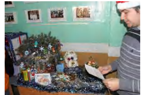
Подарунки від Миколая групи 21-М

Журі та уболівальники конкурсу потрапили у справжню новорічну казку. І