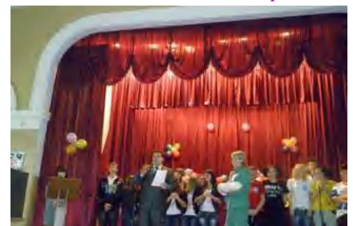
Нагородження учасників КВК